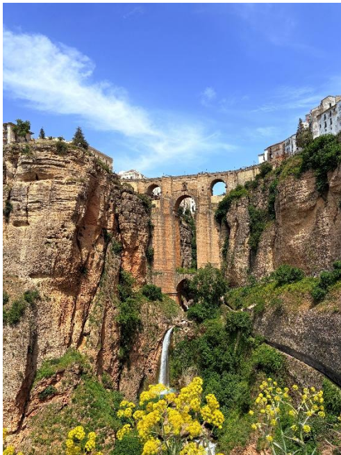
Tur til Ronda der vi så denne fine bruene.

Ellers har vi kost oss veldig mye de siste dagene vi har og gjort alt vi ville gjøre. Vi kommer til å ta med oss erfaringer og ikke minst gode minner fra disse tre ukene i Malaga.