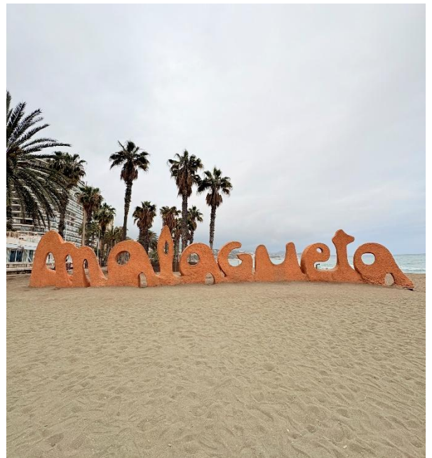
Malagueta skilt rett ved der vi bor.