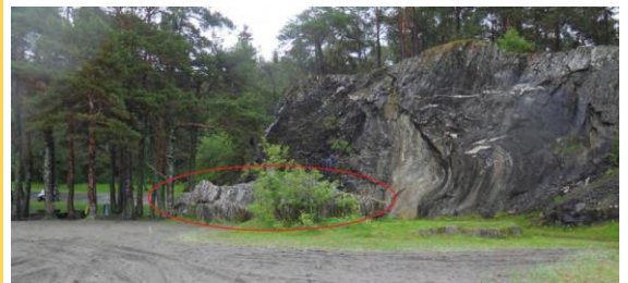
Feltarbeid i Stovvika