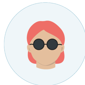
Følsomhet for sterkt lys