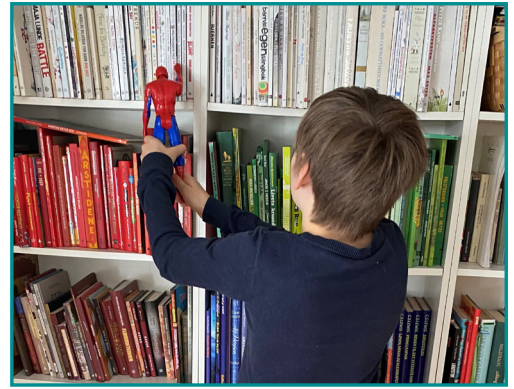
Spiderman hjelper til i bokvalget!

Aktiviteter: Bruk hjemmeskolebiblioteket for å skape leselest og som en støtte i arbeidet med oppgavene som kommer fra skolen. Fritidslesing og egen utforskning hører naturlig med. Alt dere kan og er interessert i selv kan være viktige ressurser. Hjemmeskolebibliotekets kunnskapsbase må av og til utvides med telefon-/videosamtaler med besteforeldre eller andre venner. Når bibliotekene åpner igjen kan hjemmeskolebiblioteket suppleres med lånebøker.