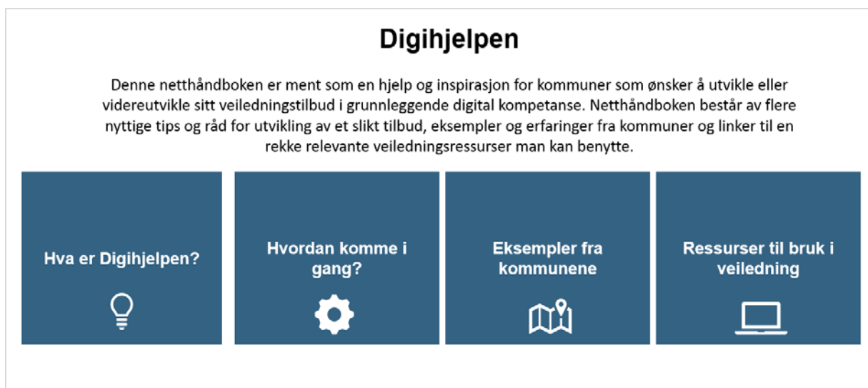
Figur 1. Visualisering av forsiden til netthåndboken og de aktuelle hovedmodulene

Figur 1 viser en oversikt over hvordan hovedsiden til netthåndboken dermed vil kunne se ut. Hovedsiden vil bestå av en tittel (Digihjelpen), en kort ingress og de fire hovedmodulene som man kan klikke seg inn på.