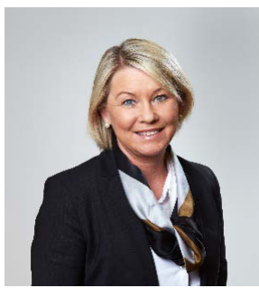
Monica Mæland Kommunal- og moderniseringsminister

Vi ønsker dere lykke til i det viktige arbeidet med å heve innbyggernes digitale kompetanse og sikre at Norge også i fremtiden vil ligge på verdenstoppen i bruk av digitale tjenester.