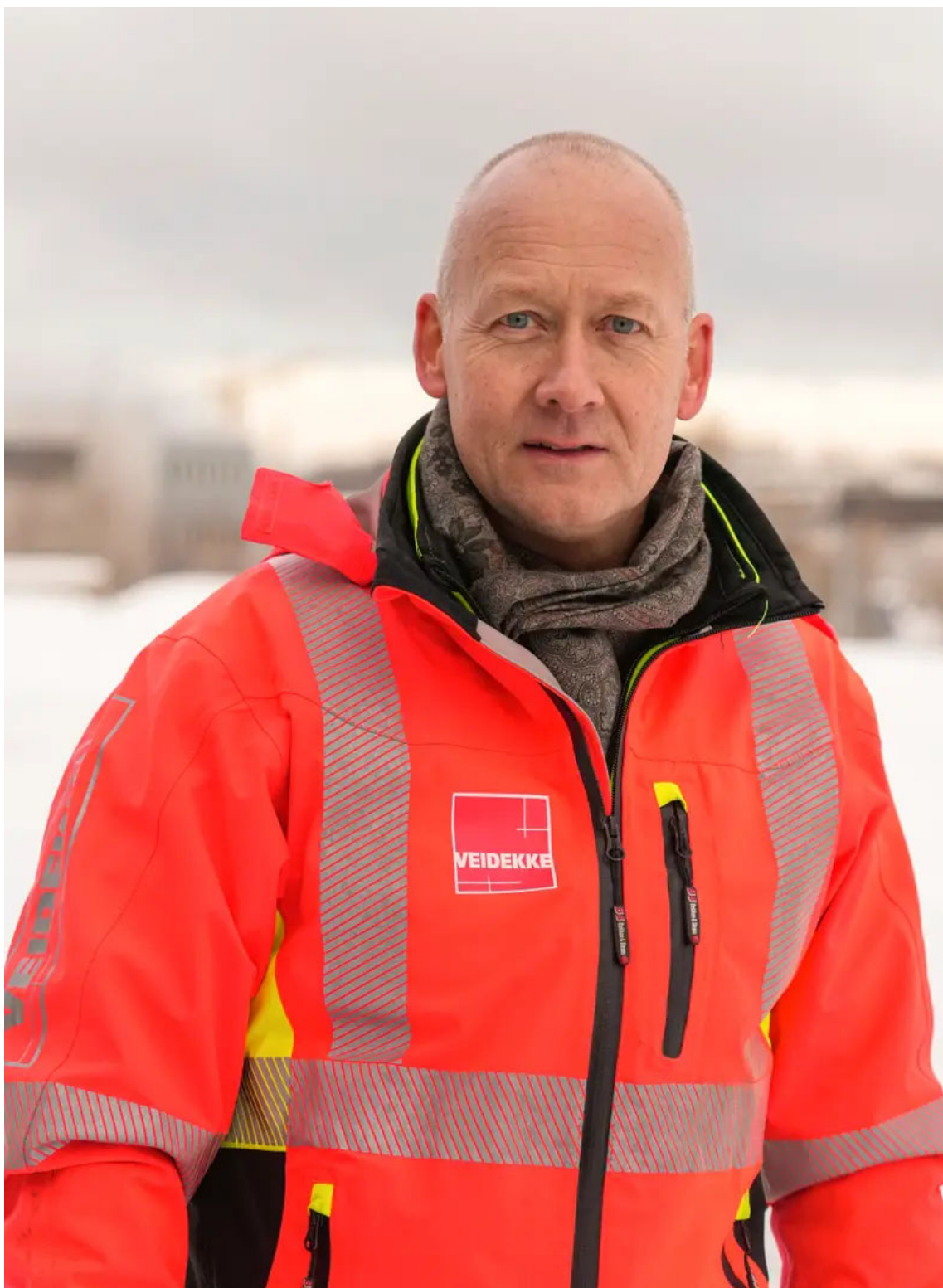
Torgeir Wiig er regiondirektør i Veidekke Bygg Trøndelag.