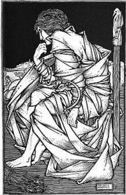
Seated on Odin's throne Hliðskjálf, the god Freyr sits in contemplation in an illustration (1908) by Frederic Lawrence

Klassen lyttet oppmerksomt. Mai Berg fortalte at «Ljod», som volven ber om i starten av Voluspaa, både betyr å lytte, og lyd.