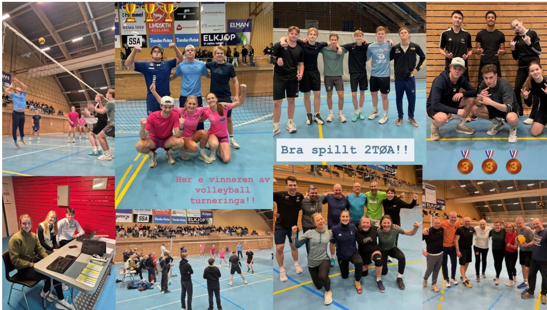
Bilder: Arrangør 3IDA og 4IDA