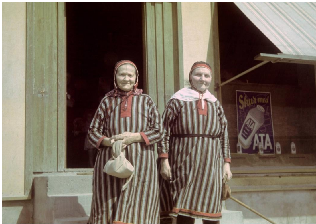
Foto: Anton Haakon Willman (1948), "Kvæner". Sannsynligvis tatt i Trondheim, men kan være et annet sted i Trøndelag. Oppbevares ved Sverresborg, Trøndelag Folkemuseum.

Kvener har flyttet til Trøndelag av andre grunner både før og etter dette.