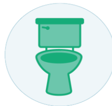
Kvalme, oppkast og diaré