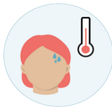
Feber med frysninger