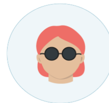
Følsomhet for sterkt lys