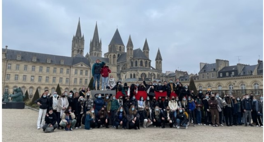
Bilde: Elever på tur i Caen.

Vi ankom Paris på formiddagen og fikk noen timer i den franske hovedstaden i nydelig vårvær.