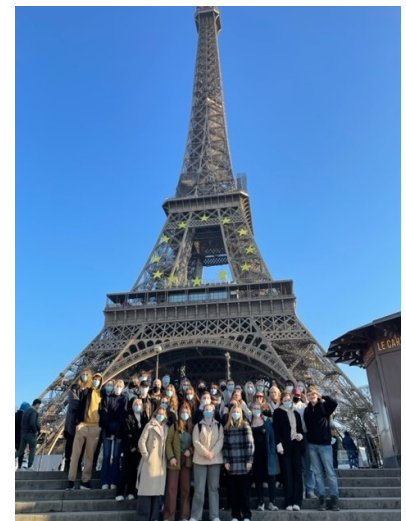
Bilde: Sightseeing i Paris