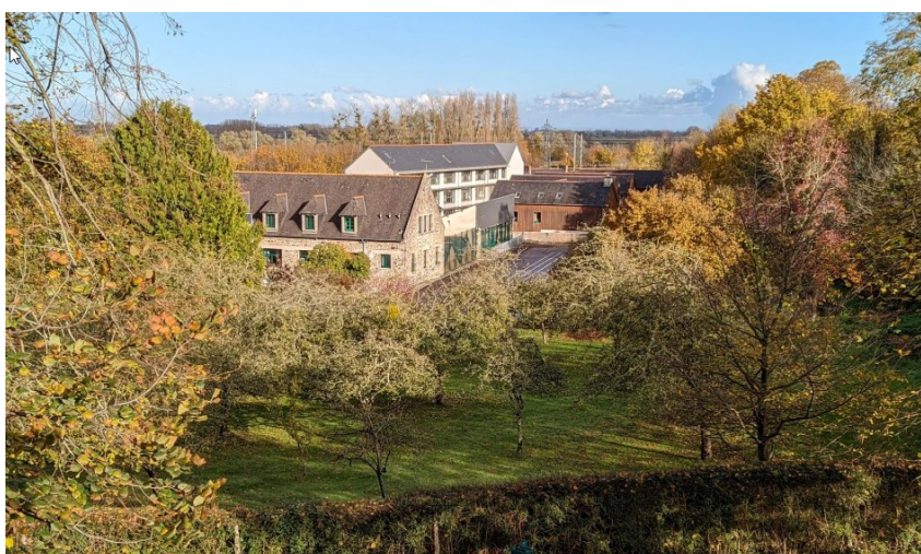
Bilde: Skolen og internat, sett fra parken.

Gjennom besøkene og omvisningen i St.Malo, Dinard og Mont st.Michel fikk vi innføring i fransk og bretonsk/normannisk historie og kultur.