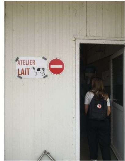
Bilder: T.v.: Her får alle elever opplæring i å melke kyr.