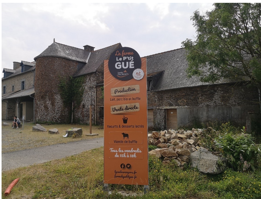
Bilde: Gårdsbutikk fra skolen.

Vi har dette skoleåret hatt besøk av fire lærere fra Les vergers ved Skjetlein, hvor de har jobbskygget våre lærere. Vi dro nå på jobbskygging hos dem og vi diskuterte videre samarbeid. Begge skoler ønsker å fortsette med dette samarbeidet, og vi ønsker å utvide det med tanke på å sende elever på utveksling. Vi tenker da særlig på elever innefor naturbruk.