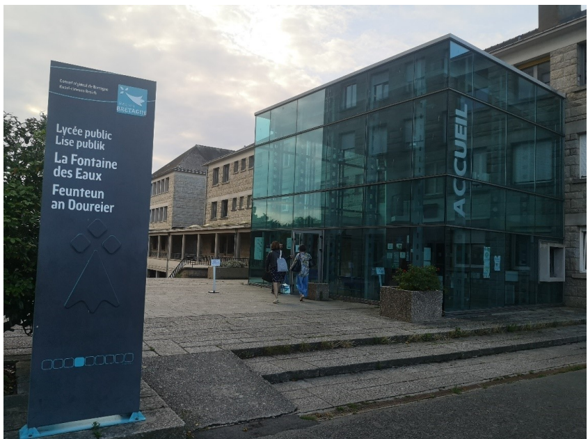
Bilde: Besøk på en samarbeidsskole fra Les Vergers, skolen La Fontaine des Eaux.