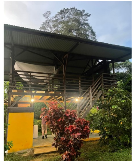
Bilder: Hos Malou, soloppgang (t.v.), Carbet med hengekøye i andre etasje (t.h.).