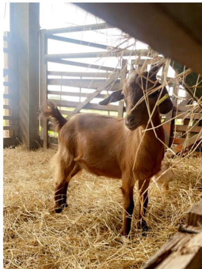
Bilder: Samarbeid med elever (t.v.), rundgang på skolen – besøk hos geitene (t.h.).