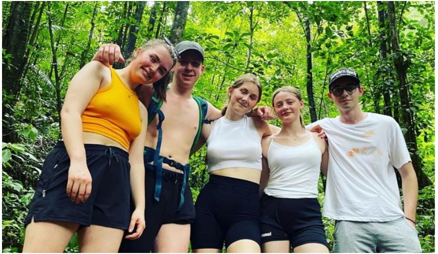
Bilde: Ekskursjon i urskoagen – dette var noe helt spesielt!

Vi hadde heldigvis hengekøye og det mest nødvendige i håndbagasjen, for bagasjen vi sjekket inn på Værnes havnet på Martinique, og kom ikke før to dager senere.