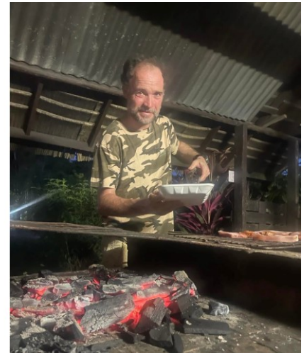
Bilder: Båttur på Kourou-river (t.v.), grillings siste kveld før hjemreisen (t.h.)

Nå hadde vi blitt litt kjent med elva, så da måtte vi utforske litt på egen hånd i kano. Med kano kommer man seg inn i små, nesten gjenvokste, sideelver (en såkalt crique). Det var veldig spennende å være på en slik ekspedisjon, litt skrekkblanda fryd om man skulle møte på noe dyreliv. Med padlinga kom også konkurranseinstinktet frem i enkelte, men i en trang crique skulle det vise seg at presisjon er viktigere enn fart!