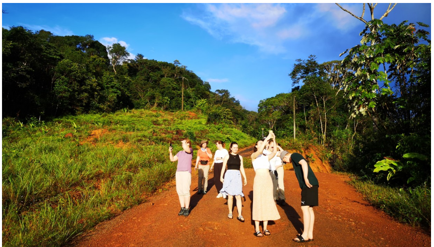
Bilde: Morgentur i urskogen på en hovedveg.