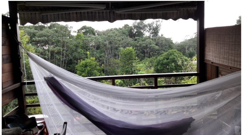
Bilde: Utsikt fra hengekøya i Carbet'en hos Malou. Myggnetting er viktig å ha pga. Malaria og Dengue feber.

Da vi spiste lunsj på en lokal restaurant/café, kunne vi se skytteltrafikk av lokale bønder som kjørte til og fra markene med fihjulinger, traktorer eller små lastebiler. Hmong – folket