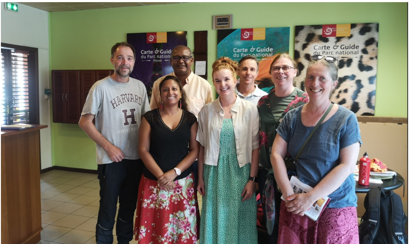
Bilde: Det ble ikke tur til Saul, men vi ble godt tatt imot på hovedsetet til Parc-Azonien de Guyane. De jobber med vern av urskog og jobber tett sammen med urfolket i Sør i Fransk Guyana. Det foregår ulovlig gull graving der nede, målet av politiet er å ødelegge så mye utstyr som mulig slik at det blir vanskelig å starte opp igjen.

Tekst og fotos: Line Langø, Gjertrud Jensen, Vigdis Jonsen, Stefan Preisig